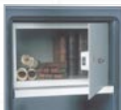
Equipements intérieurs (en partant de la gauche) : tablette, armoire à clé